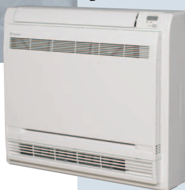
Vnúťorná jednotka FVXS