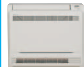
FVXS 25, 35, 50 F